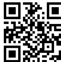
中津中央RC HP QR コード