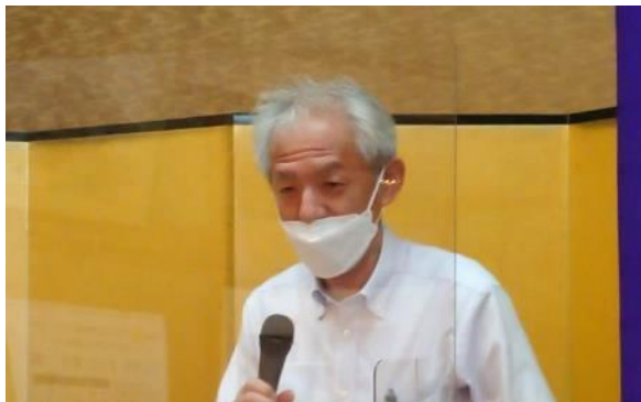
■一年間を振り返って 恒藤会長