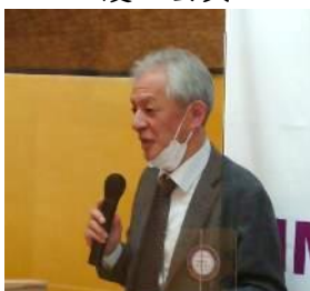
奉仕プロジェクト委員会 梅高会員