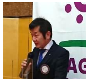
ロータリー財団委員会 諫山会員