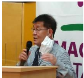
会員維持増強委員会 慶田会員