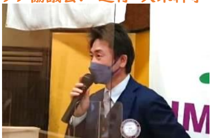
クラブ管理運営委員会 三宮会員