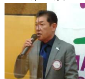
大田RC交流特別委員会 大賀会員