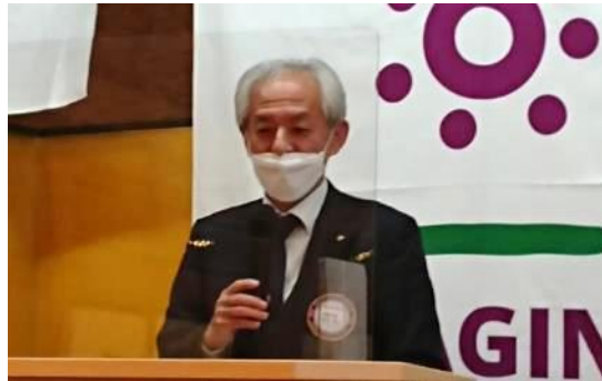
諫山会員:入会記念品を頂き、ありがとうございました。