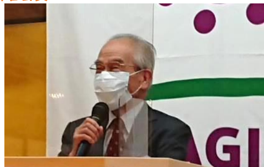
堂本会員:コロナは大変です。皆さん第8波に注意して下さい。