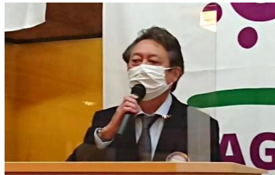
梅高会員:入会月のお祝いをありがとうございました。