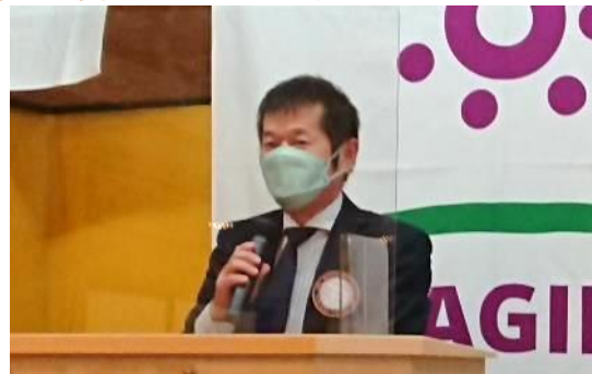
古田会長:入会記念品ありがとうございました。