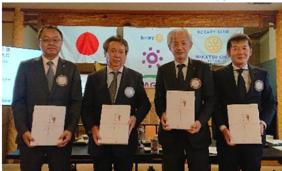
古田会長・安田会員・梅高会員・諫山会員