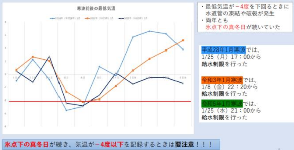
最低気温の推移の比較(平成28年1月寒波と令和3年1月寒波と令和5年1月)