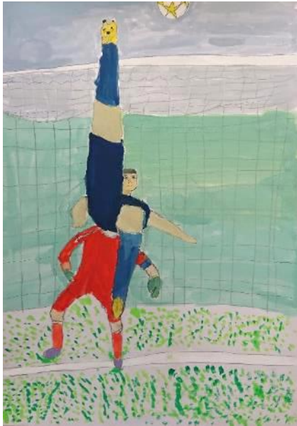
優秀賞 サッカー選手