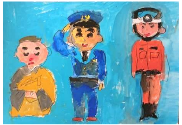
中津市商工会議所会頭賞 お坊さん