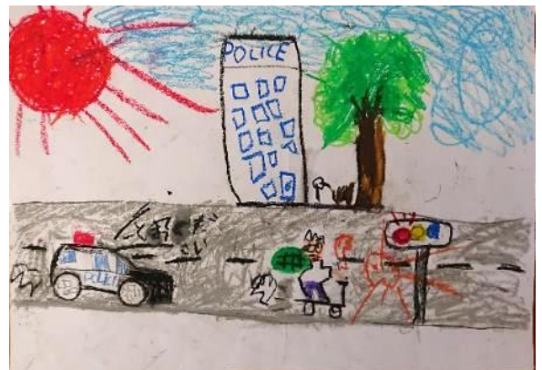
国際ロータリー賞 警察