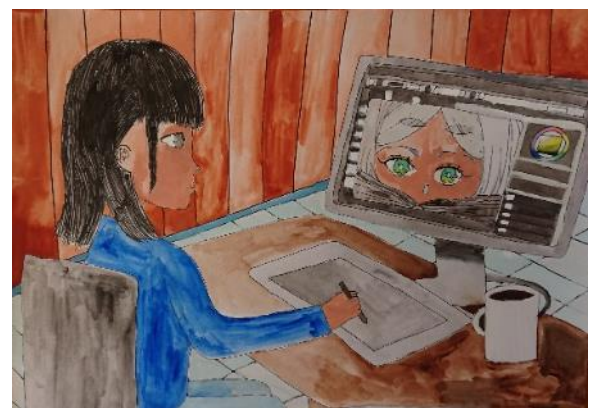
中津中央ロータリークラブ会長賞 イラストレーター