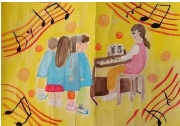
中津市長賞 保育士