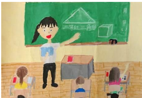
中津市教育長賞 教師