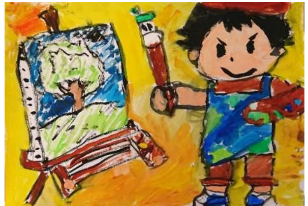
中津市 PTA 連合会会長賞 画家