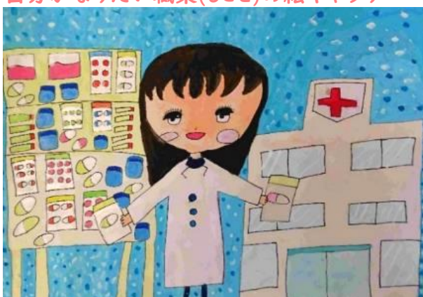
第12回最優秀賞 薬剤師