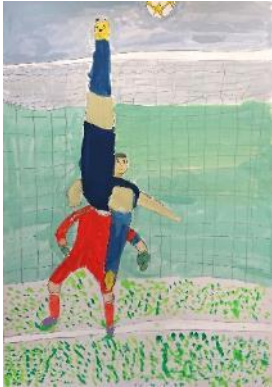
第12回優秀賞 サッカー選手