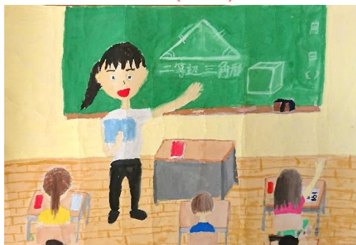
第12回中津市教育長賞 教師