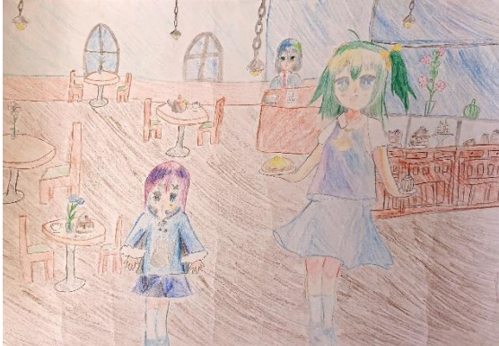
第12回入選 お菓子屋さん