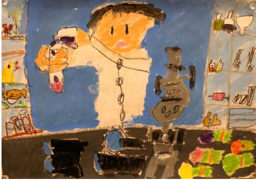
第14回中津市 PTA 連合会会長賞 研究者