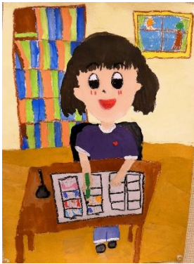
第14回中津中央 RC 会長賞 漫画家