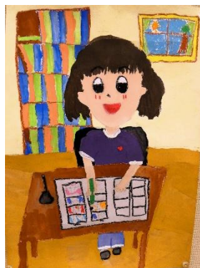
第14回中津中央 RC 会長賞 漫画家